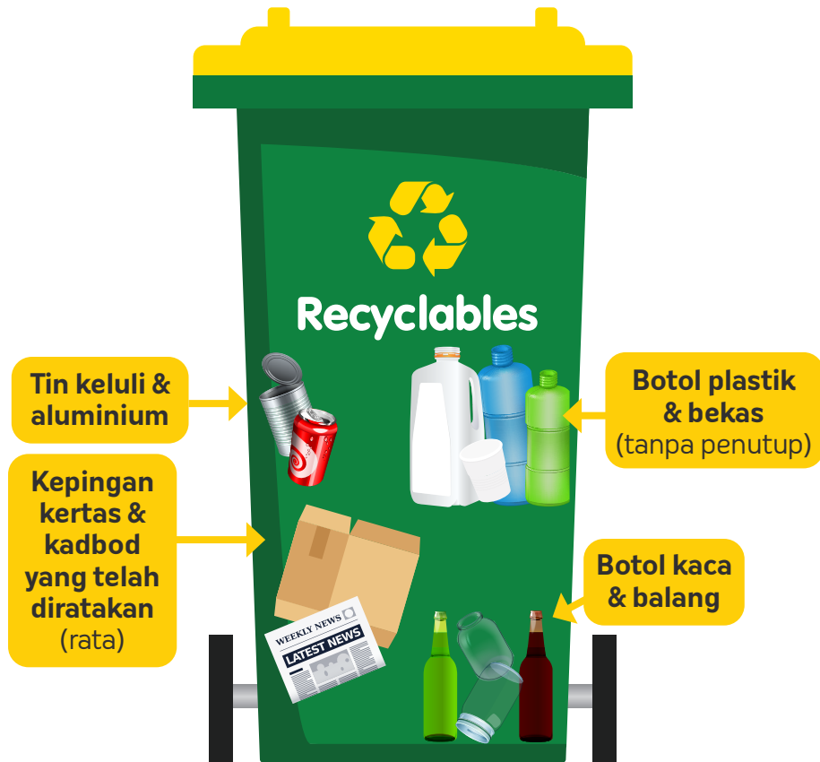
Tong Sampah Kitar Semula