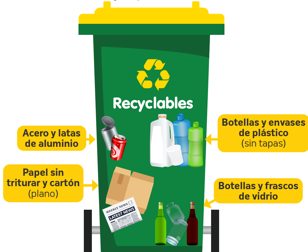
Contenedor de Papel y cartones